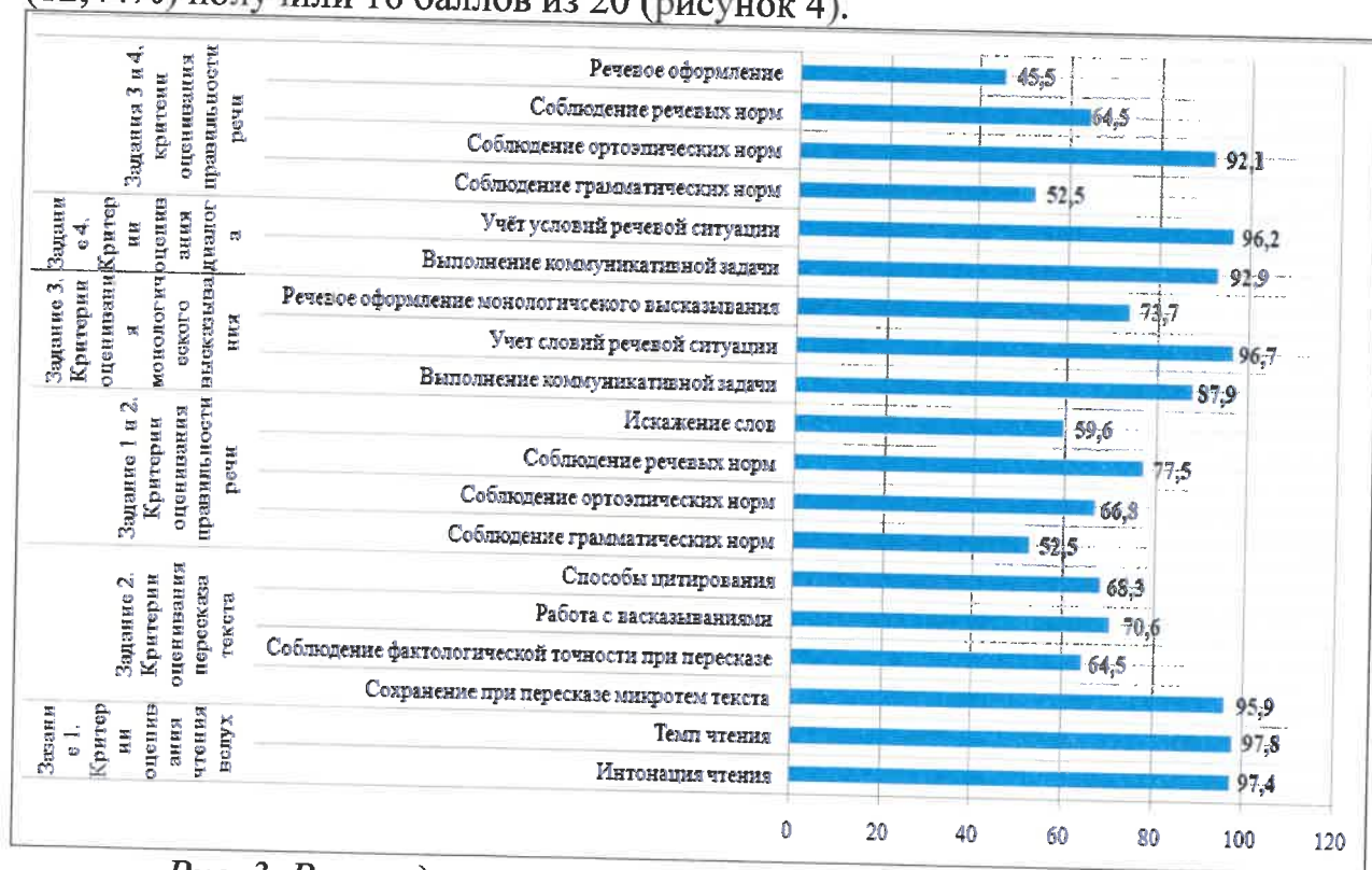
Рис. 3. Распределение участников итогового собеседования по критериям выполнения заданий, %

Распределение участников итогового собеседования по сумме баллов позволяет сделать вывод о том, что максимальное количество участников (12,44%) получили 16 баллов из 20 (рисунок 4).